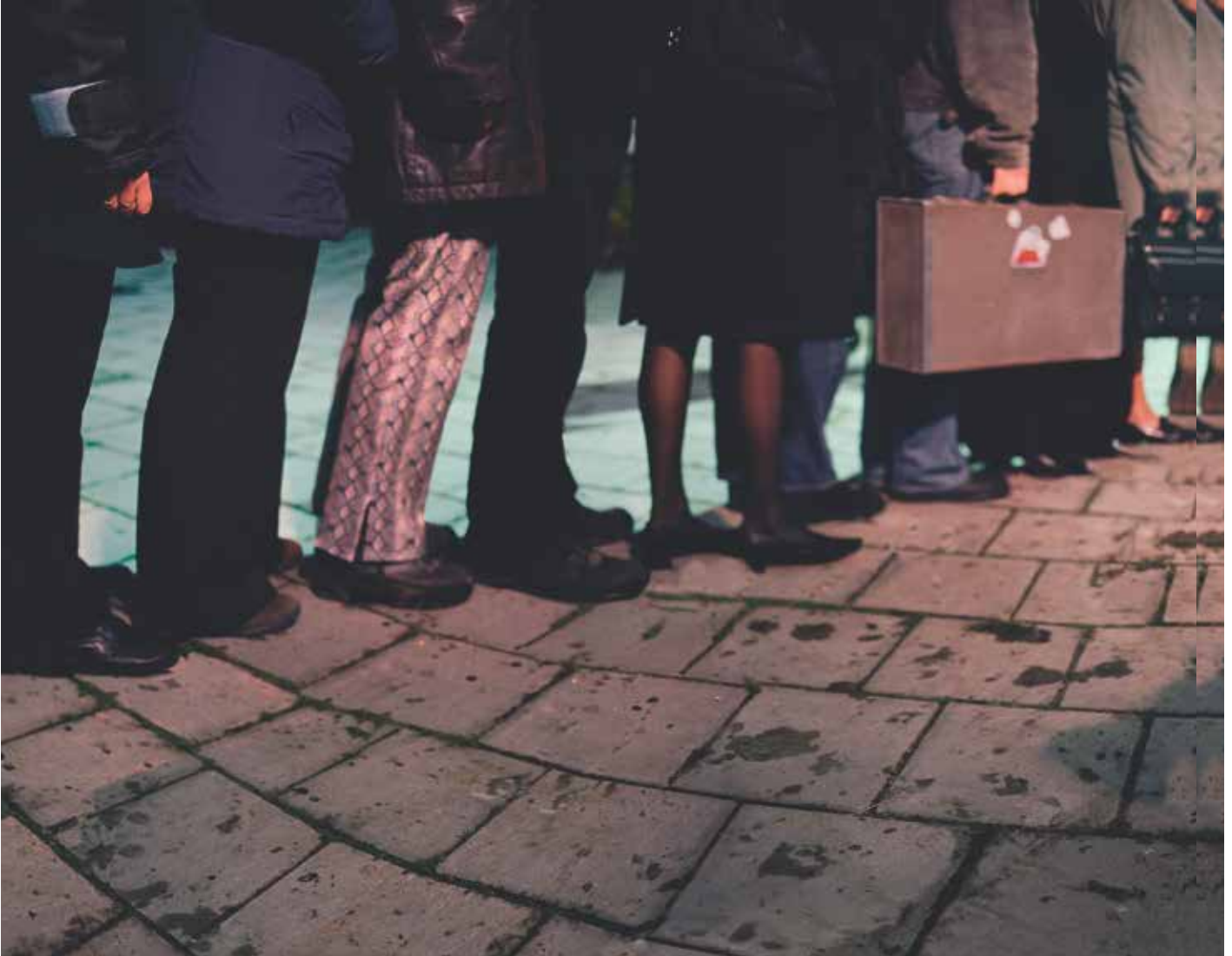
ALPHEN AAN DE RIJN-PAD